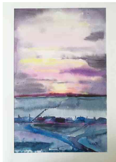
Примеры живописных этюдов