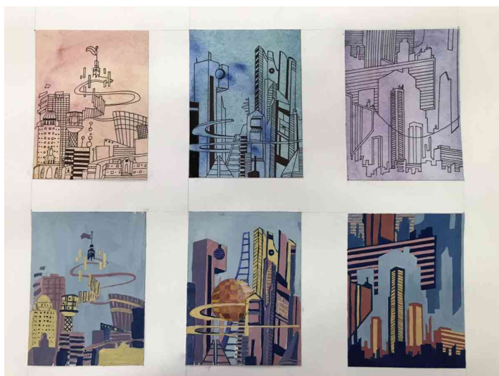
Примеры стилизации архитектуры

Определение цветового акцента. Им может стать один или два насыщенных пятна. Выполняется заполнение контуров, изображенных на втором этапе, любым цветом в соответствии с авторским замыслом. Для этого нужно определиться, какие цвета являются более характерными для изображаемого объекта. На этом этапе необходимо знание законов цветоведения о взаимно дополнительных цветах, контрасте ярких и светлых цветов по отношению к темным.