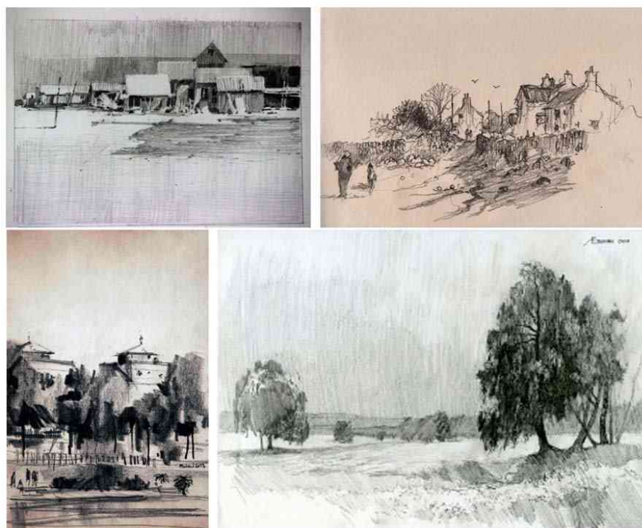
Пейзажные зарисовки разными материалами

Рисование пейзажных зарисовок требует знаний и умений передачи линейной и воздушной перспективы. При выполнении работы на открытом воздухе следует помнить об основных явлениях воздушной перспективы. По мере удаления объектов изображения происходят следующие изменения: